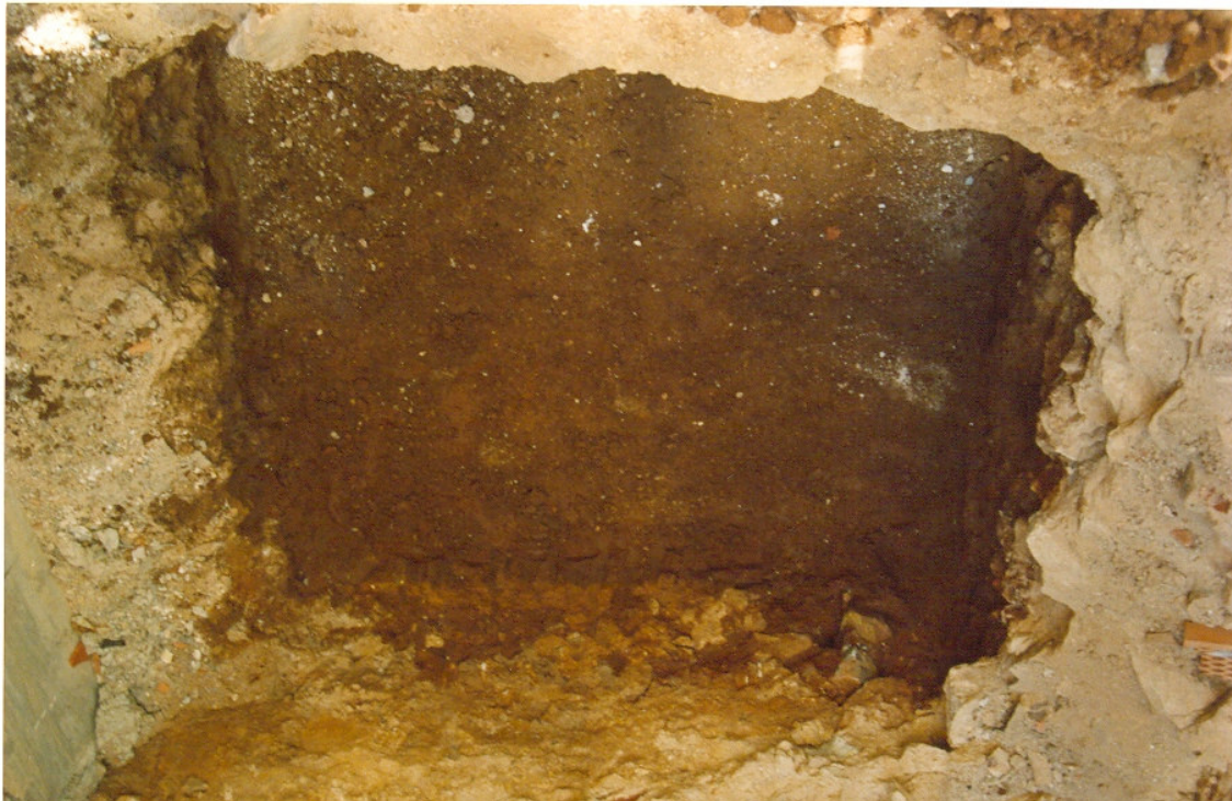
Fig.1.- Fotografia general de la caixa d'ascensor de l'immoble situat al C/Carders, 23.