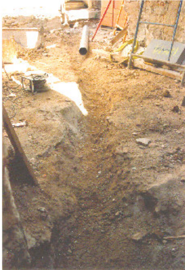
Fig.2.- Detall de la rasa de la canonada d'evacuació d'aigües.